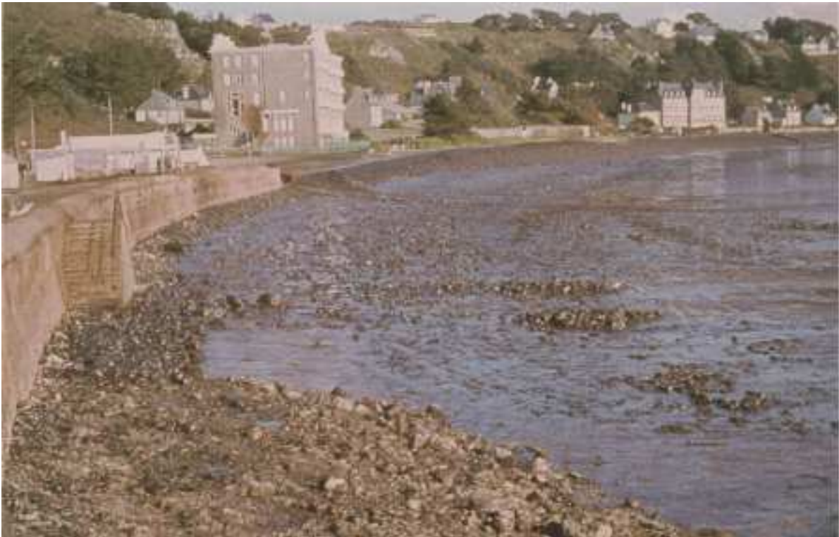
Trébeurden : Plage de Tresmeur Amoco Cadiz 1978

Lors des travaux de nettoyage des plages souillées par le pétrole, des dizaines de milliers de m 3 de sable ont été soustraits aux plages de Trébeurden, induisant ou accentuant le déficit sédimentaire.