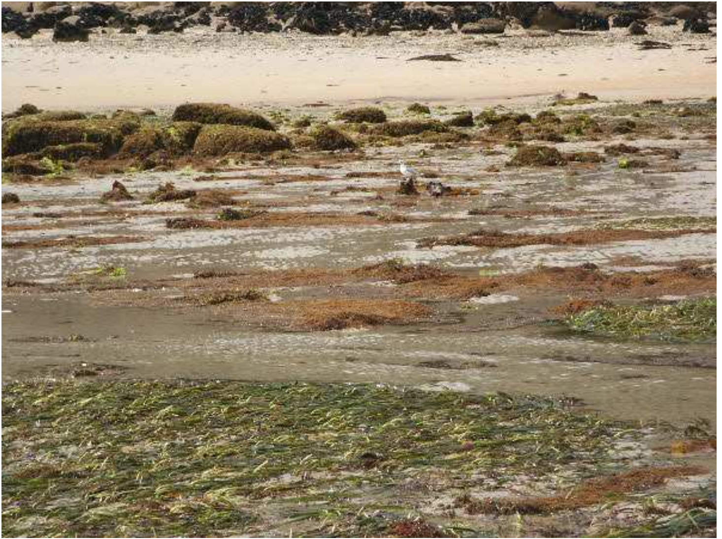
TREBEURDEN : Passe de Milliau