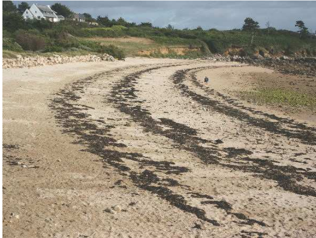
TREBEURDEN : Plage de Toéno