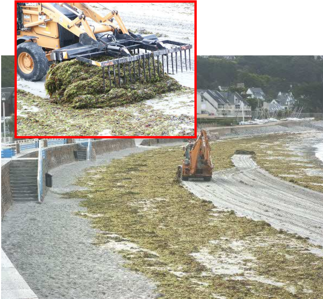
TREBEURDEN : Plage de Tresmeur 22 juillet 2009

Les algues vertes, à la différence des algues brunes, sont donc à retirer.