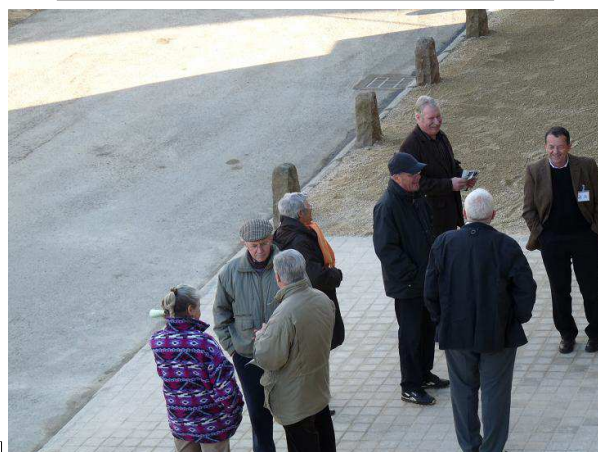
On discute encore quelques minutes ...