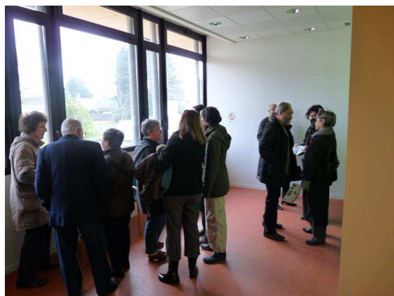
Un groupe de discussion s'est formé ...

Une "édition spéciale" du Treb'Info, distribuée à l'accueil servait de plan de circulation pour le rez-de-chaussée aussi bien que pour l'étage. La salle du Conseil abritait la projection d'un diaporama relatant les différentes étapes du chantier de réhabilitation-extension de la mairie.