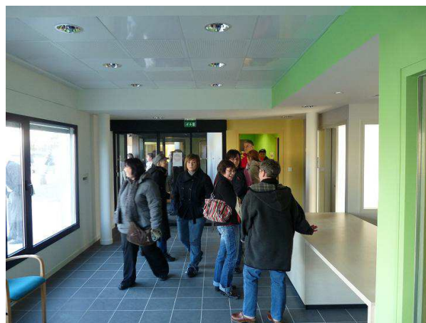
Le hall d'accueil (très fréquenté ce samedi) ...

L'ouverture de la nouvelle mairie au public devrait avoir lieu début avril après le déménagement des différents services (administratifs, techniques, CCAS ....)