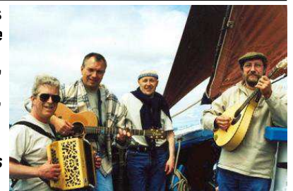
le groupe lorientais "Nordet"

Les bénéfices de ce "cabaret marin" seront entièrement reversés aux stations locales de la SNSM.