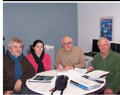
L'équipe en charge de la préparation de l'évènement

Le Centre Activités Plongée de Trébeurden (CAP), coordonne la mise en place d'un projet ambitieux qui se déroulera du vendredi 20 au jeudi 26 mai 2011 : La Semaine des Mondes Sous-Marins. Durant cette semaine, parrainée par Pierre-Yves Cousteau, Pdt de Cousteau Divers et fils cadet du célèbre Commandant Cousteau, Trébeurden va devenir le théâtre d'évènements majeurs tournés vers la mer.