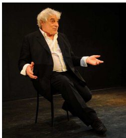
Jacques Weber le 26/11/2011

Bref, une vingtaine de belles rencontres professionnelles avec des chanteurs, des humoristes, des comédiens, des marionnettistes, des musiciens ... Durant cette seconde saison, quelques nouveautés seront proposées : les chèques-cadeaux, l'échange de places (un avantage réservé aux abonnés), les formules "cabaret" (les spectateurs découvriront les artistes dans une ambiance "cabaret", installés autour de petites tables) et l'ouverture prochaine d'un nouveau site internet sur lequel vous pourrez réserver vos places et réaliser votre abonnement.