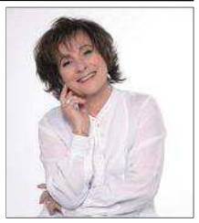
Marie-Paule Belle le 30/03/2012