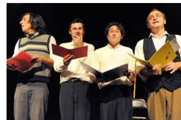
La chorale Gruppetto