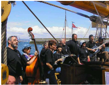
les Kanerien Trozoul