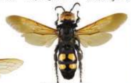
Scolie des jardins, Megascolia maculata

Le sirex géant est un Hyménoptère dont la larve se nourrit de bois. La femelle peut atteindre 4,5 cm, a une coloration proche du frelon asiatique, mais s'en distingue facilement par des antennes longues entièrement jaunes ainsi que par la présence d'une longue tarière lui permettant de pondre dans le bois. Cet insecte est inoffensif.