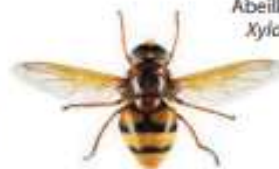
Volucelle zonée, Volucella zonaria

De nombreuses mouches (Diptères) peuvent ressembler à des guêpes ou des frelons. Mais à la différence de ceux-ci elles ne possèdent qu'une seule paire d'ailes au lieu de deux. Leurs yeux sont généralement beaucoup plus globuleux et leurs antennes plus courtes.