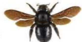
Abeille charpentière, Xylocopa violacea

L' abeille charpentière mesure entre 2 et 3 cm. C'est l'une des plus grandes abeilles européennes. Elle est entièrement noire avec des reflets bleu violacés. Elle construit son nid dans le bois mort et nourrit ses larves de pollen.