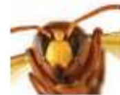
Frelon oriental, Vespa orientalis

Le Frelon oriental , Vespa orientalis , est de la même taille que le Frelon d'Europe. Il est entièrement roux, seulement la face antérieure de sa tête et une bande de son abdomen sont jaunes. Il est naturellement présent dans le Sud-Est de l'Europe (sud de l'Italie, Malte, Albanie, Grèce, Chypre, Roumanie, Bulgarie), mais a été introduit en Espagne et dans le nord de l'Italie.