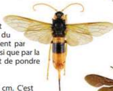
Sirex géant, Urocerus gigas

La Scolie des jardins , Megascolia maculata , fait partie des plus imposantes "guêpes" européennes. Sa pilosité est très épaisse. Son corps est noir brillant, sa tête est jaune sur le dessus et elle possède 4 zones jaunes et glabres sur l'abdomen. C'est un parasite de larves de gros Coléoptères.