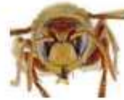
Frelon d'Europe, Vespa crabro

Le frelon d'Europe , Vespa crabro , a l'abdomen à dominante jaune clair, avec des bandes noires. Sa tête est jaune de face et rouge au dessus. Son thorax et ses pattes sont noirs et brun-rouges. Les ouvrières mesurent entre 18 et 23mm et les reines entre 25 et 35.