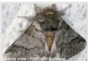
Adulte mâle - FREDON Bretagne